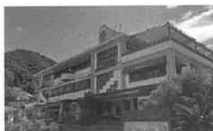
のじまスコウラ(研修施設)