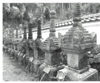
徳源院京極家墓所

米原から二駅先の柏原(かしわばら)近くには国の史跡・徳源院(清滝寺)があり、四季折々の庭園が美しい。ここに京極家累代の墓所があり、京極家の”聖地”の為に、丸亀藩はこの周辺を飛び地として所領し、丸亀・多度津の両藩は参勤交代の折に訪れ参拝した。丸亀市が復活に取り組んでいる道萱桜の原木はこの境内にある。